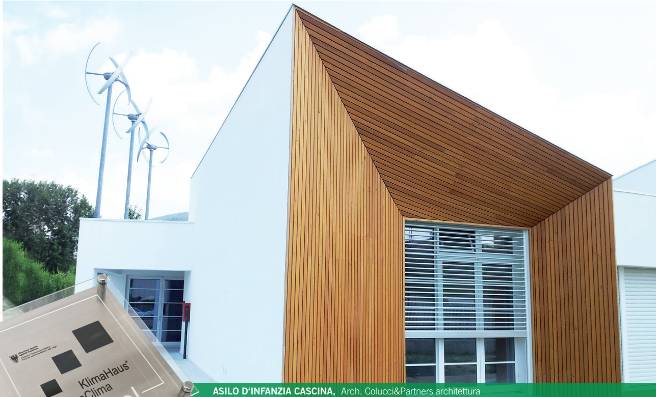
ASILO D'INFANZIA CASCINA, Arch. Colucci&Partners architettura

CasaClima School premia gli edifici scolastici di nuova costruzione o risanati, compatibili con un'idea di sostenibilità in cui vengono considerati sia gli aspetti ecologici che quelli sociali ed economici.