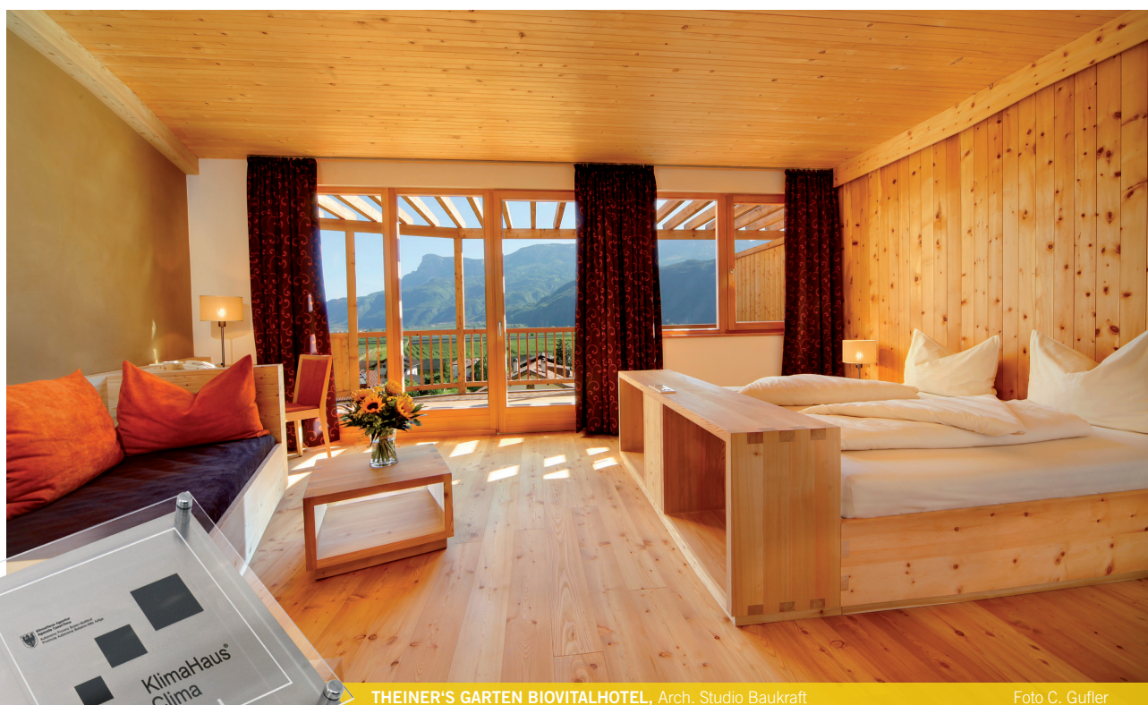
THEINER'S GARTEN BIOVITALHOTEL, Arch. Studio Baukraft